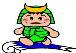
敦賀市公認キャラクター

敦賀市は、低炭素社会の実現に向け、この「COOL CHOICE」に賛同し、市民・市民団体・事業者の皆さんと連携・協働しながら地球温暖化対策を推進します。